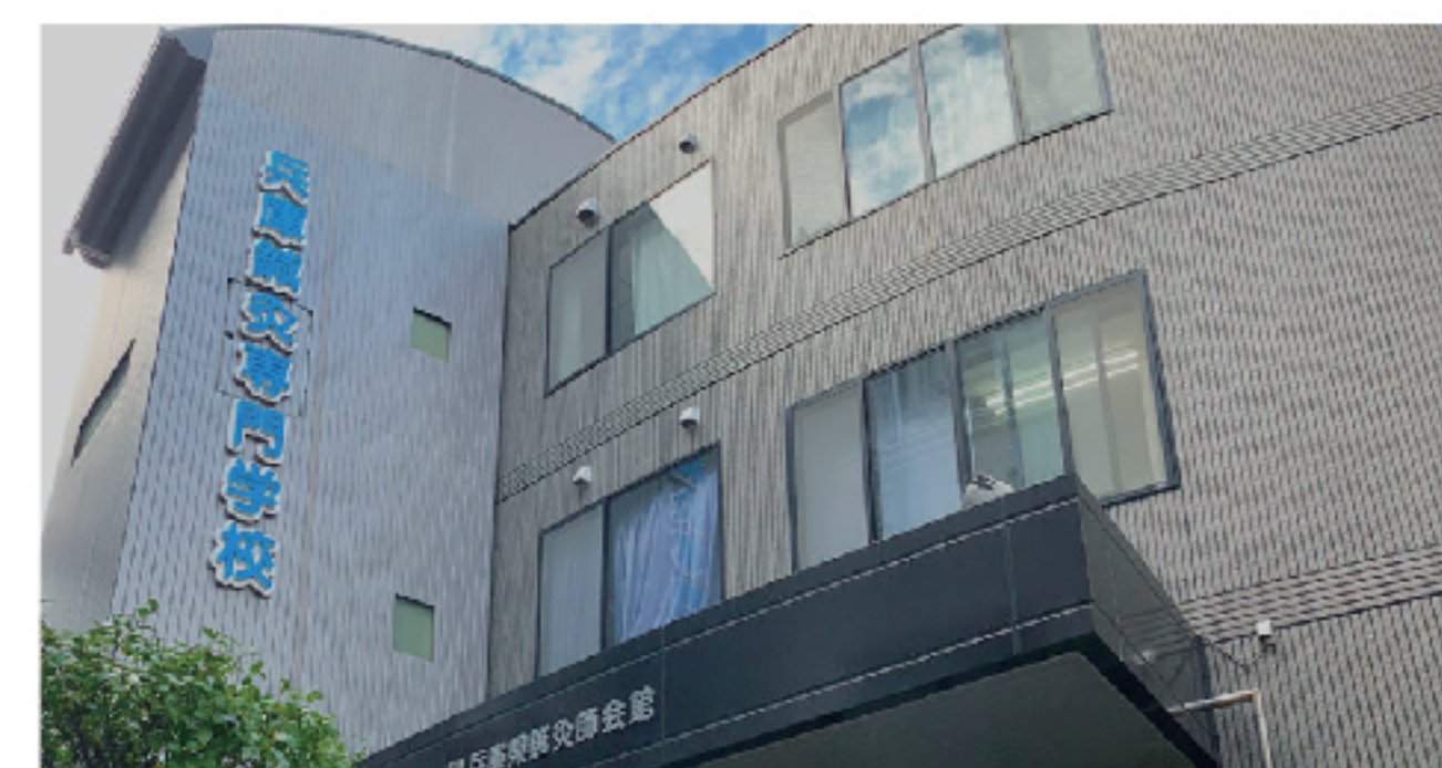
学校法人 兵庫鍼灸専門学校