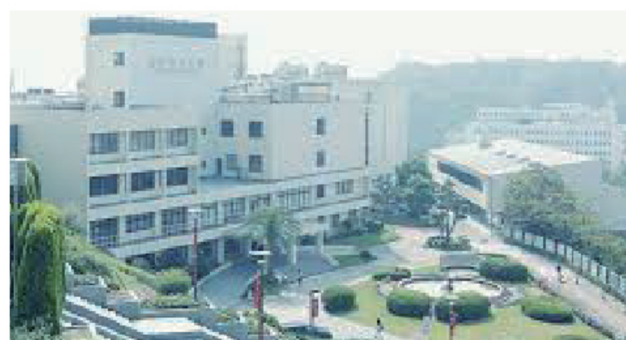
神戸女子大学 オープンガレージ