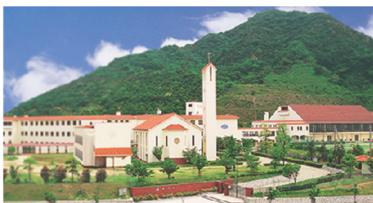
関西学院大学継続 学校法人啓明学院